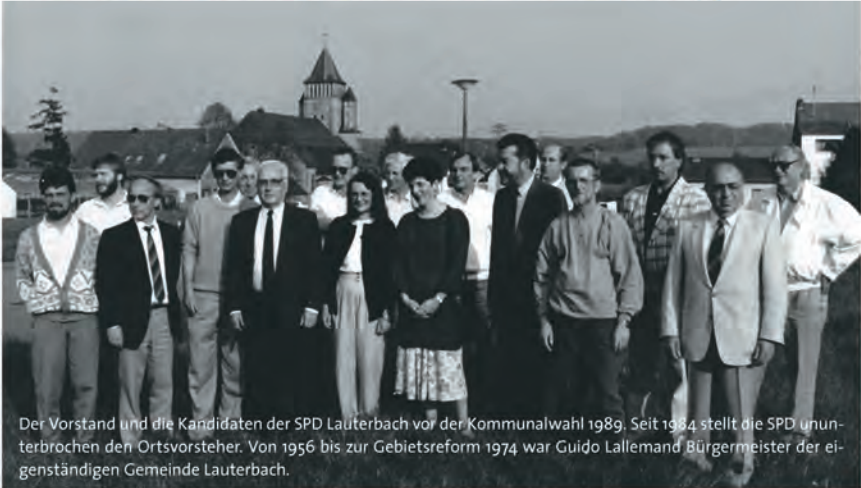
Der Vorstand und die Kandidaten der SPD Lauterbach vor der Kommunalwahl 1989. Seit 1984 stellt die SPD ununterbrochen den Ortsvorsteher. Von 1956 bis zur Gebietsreform 1974 war Guido Lallemand Bürgermeister der eigenständigen Gemeinde Lauterbach.

Die SPD Lauterbach feiert 2015 wieder einen runden Geburtstag: wir werden sechzig!