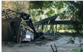
... und nach dem Brand 2014