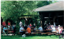
Vor dem Brand 2010...

Am 3. Juni hatte sich die Maudacher SPD getroffen, um das für August vorgesehene Bruchfest zu planen. Am nächsten Morgen war die Überraschung groß, als gemeldet wurde „Festhalle im Maudacher Bruch ist abgebrannt“.