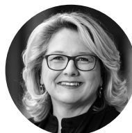
Svenja Schulze, MdB Mitglied des SPD-Parteivorstands Schirmherrin des Projekts