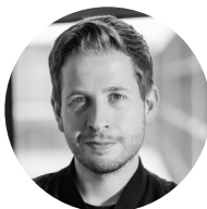
Kevin Kühnert, MdB Generalsekretär